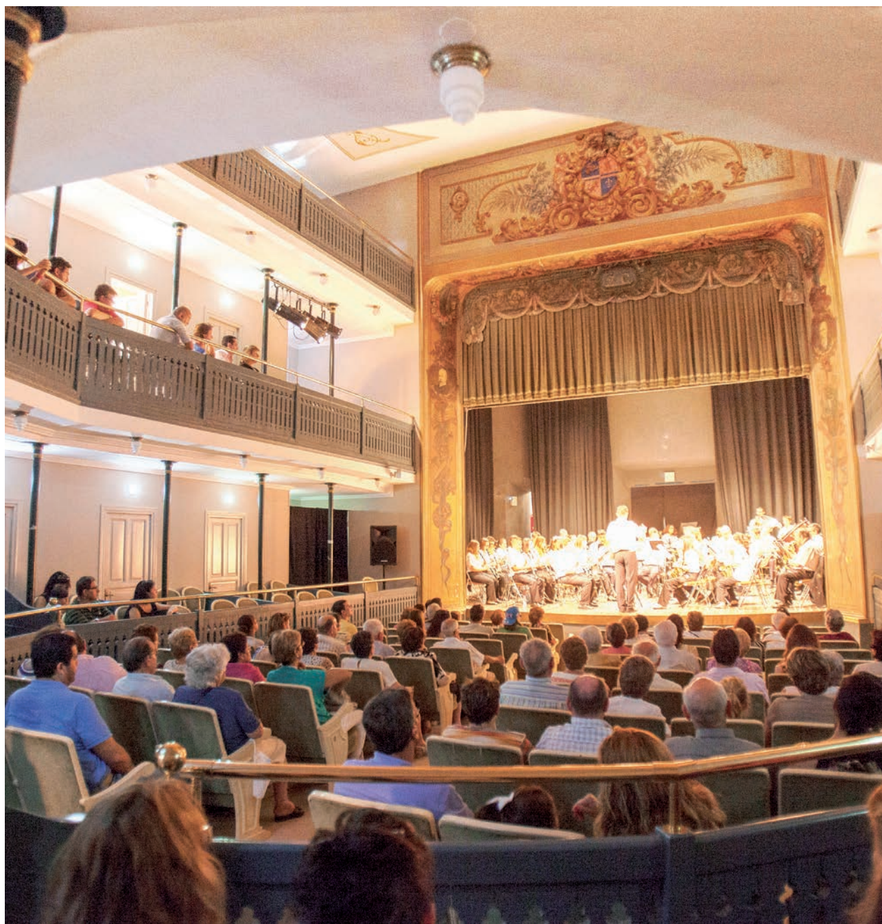
San Roque.