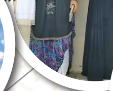
Sant Andreu de la Barca - Barcelona