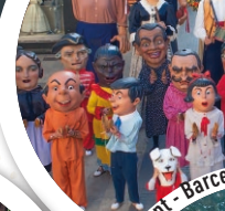
Vinaros - Castellon