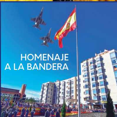
HOMENAJE A LA BANDERA