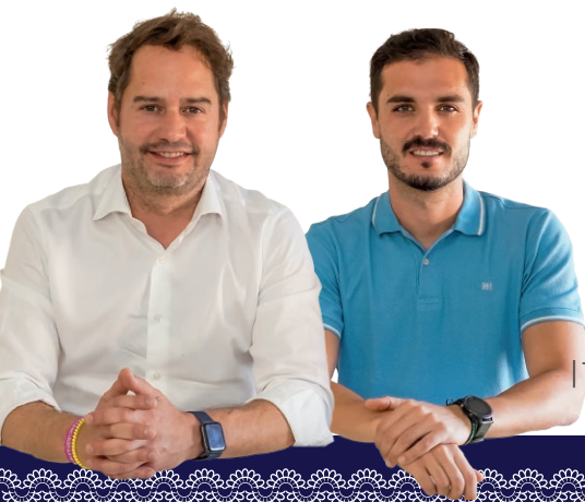
Ignacio Vázquez Casavilla | Alcalde

“Estas fechas son donde nuestras tradiciones adquieren mayor protagonismo, junto a diferentes actividades de carácter festivo que hacen de Torrejón de Ardoz un lugar entrañable.”