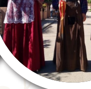
Sant Vicenç de Montalt - Barcelona