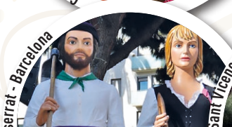
Gegants i Galls de Casablanca de Sant Boi de Llobregat - Barcelona