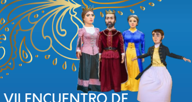
VII ENCUENTRO DE GIGANTES Y CABEZUDOS