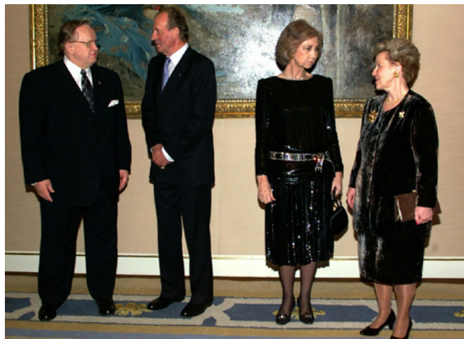
Los entonces reyes de España, junto al antiguo presidente de Finlandia, Martti Ahtisaari y su esposa, Eeva Ahtisaari, durante la visita oficial que realizaron a España.