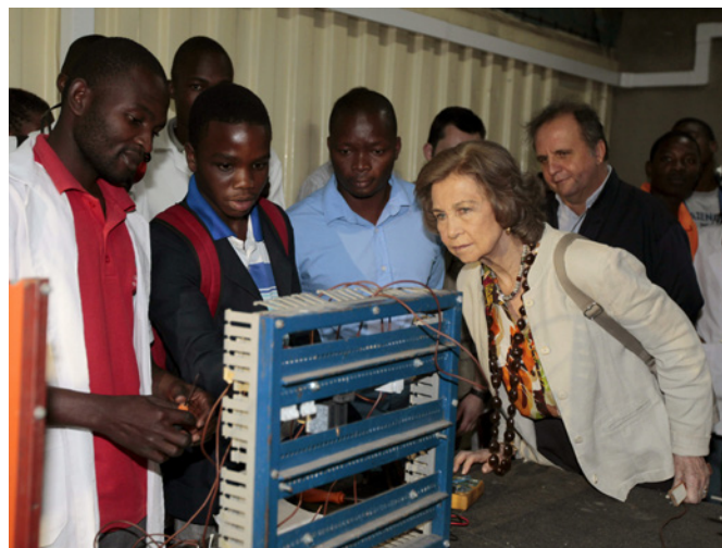
La reina doña Sofía, durante la visita a varios proyectos financiados por la Cooperación Española, en Maputo en abril de 2013.

Desarrolló su carrera profesional en la empresa nacional de ferrocarriles, Caminhos de Ferro de Moçambique (CFM) en la ciudad de Nampula, donde ocupó sucesivos puestos entre 1992 y 2007. En ese año fue trasladado a Maputo y ocupó el cargo de Administrador Ejecutivo de CFM hasta su nombramiento como Ministro de Defensa en 2008.