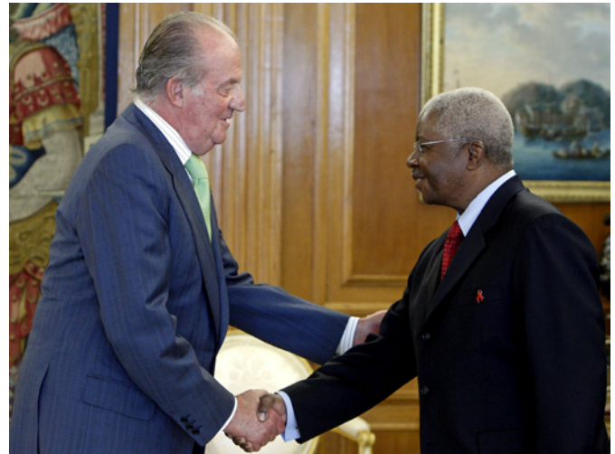
El rey Juan Carlos saluda al presidente de Mozambique, Armando Guebuza, durante su visita a España en octubre de 2010.

Salud y educación, junto a gobernabilidad (descentralización, justicia y apoyo al desarrollo territorial), han constituido los ejes temáticos prioritarios de la cooperación española en Mozambique.