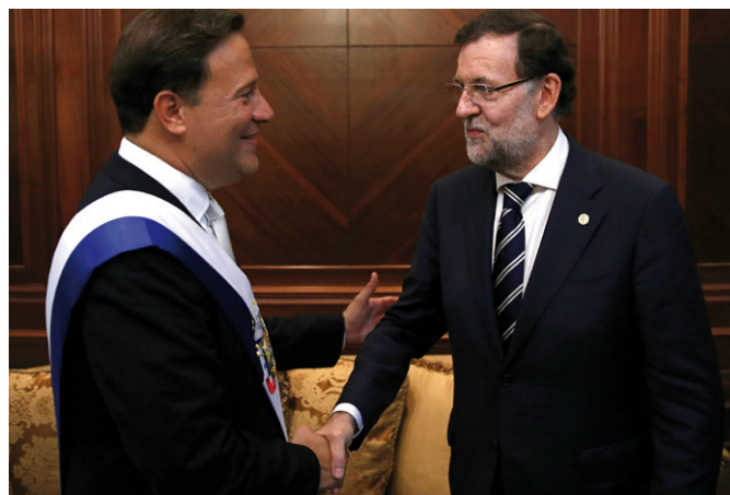
El presidente del Gobierno, Mariano Rajoy, saluda al presidente de Panamá, Juan Carlos Varela, en su toma de posesión en julio de 2014.

Sobre esta base de neutralidad, determinados acontecimientos en los últimos años, como son la decisión de proceder a la ampliación del Canal y la pertenencia al Consejo de Seguridad de NNUU en el periodo 2007-2008 han situado a Panamá en un escenario de mayor visibilidad y presencia internacional, máxime con los datos de una economía en crecimiento que ha sabido resistir a los embates de la crisis económica y financiera internacional.