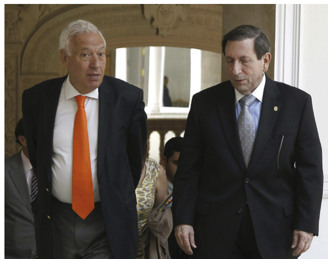
El ministro de Asuntos Exteriores y de Cooperación, José Manuel García-Margallo, junto a entonces homólogo panameño, Fernando Núñez Fábrega, durante su visita a Madrid en julio de 2013.

Fuente: D. G. Aduanas y elaboración propia