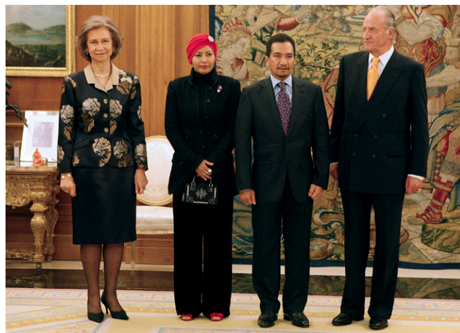
SS. MM. los Reyes de España, junto al los Reyes de Malasia, durante la visita oficial SS.MM. de Malasia que realizaron en octubre de 2008.