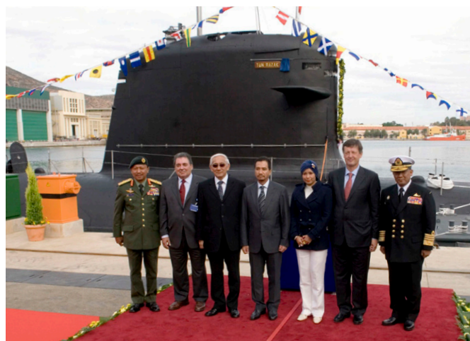
Los reyes de Malasia, durante la visita a los astilleros de Cartagena en octubre de 2008, donde presidieron el acto de puesta a flote del segundo submarino fabricado para Malasia por la empresa española Navantia.

Un hito en las relaciones bilaterales fue la visita que realizó S.M. el Rey de Malasia Azlan Muhibuddin Shah a España, en julio de 1992, en el curso de la cual