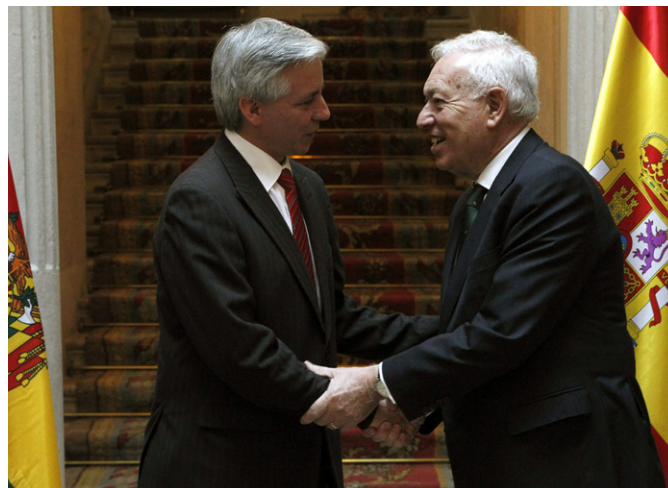
El ministro de Asuntos Exteriores y de Cooperación saluda al vicepresidente de Bolivia, Álvaro García Linera, durante su visita a Madrid en diciembre de 2013 © FOTO MAEC.

Aunque el país sigue dividido políticamente entre el occidente andino y el oriente subtropical, las tensiones separatistas que caracterizaron el primer mandato de Evo Morales parecen hoy en gran medida superadas. Las relaciones entre el Gobierno y la oposición siguen siendo tensas y se han visto afectadas por la suspensión de dos de los tres gobernadores departamentales de la oposición electos en 2010. Tras un 2011 que vio un recrudecimiento de las tensiones sociales, con múltiples bloqueos y manifestaciones, 2012 ha transcurrido en un ambiente de relativa tranquilidad política y de orden público. Aunque el Presidente Morales y el MAS han ido perdiendo popularidad a lo largo de este segundo mandato presidencial, Evo Morales sigue