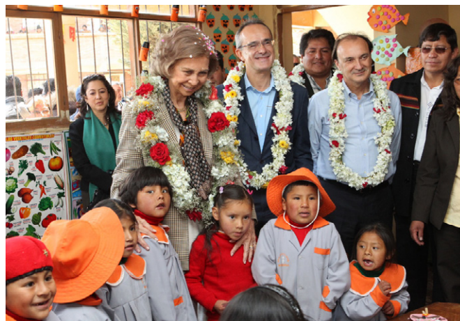
S.M. la reina doña Sofía, junto al embajador de España, Ángel Vázquez, y el secretario de Estado, Jesús Gracia, durante su visita la Unidad Educativa "España" en el marco de su viaje oficial a Bolivia en octubre de 2012.

Las relaciones bilaterales de Bolivia con España pueden calificarse de buenas. El ambicioso programa de cooperación al desarrollo y de asistencia financiera, la inversión en sectores clave de la economía, la oferta de becas, la acción cultural y de formación específica y por último la acogida en España de un número muy importante de ciudadanos bolivianos hacen de nuestro país un socio importante para Bolivia.