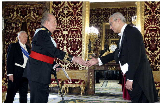
S.M. el Rey Juan Carlos, saluda con el Embajador de Cabo Verde, Mario Ferreira Lopes, en la presentación de cartas credenciales, en enero de 2013.

La presencia empresarial española es sobre todo visible en el sector turístico, destacando los complejos hoteleros de las cadenas RIU, IBEROSTAR y SOL-