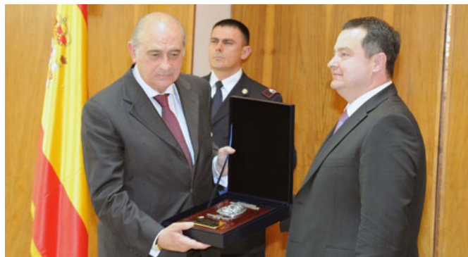
El ministro del Interior, Jorge Fernández Díaz, es condecorado por su homólogo serbio en marzo de 2012, tras la detención en España del responsable del asesinato del primer ministro de Serbia en 2003.

residuos en la ciudad de Kikinda (Vojvodina).