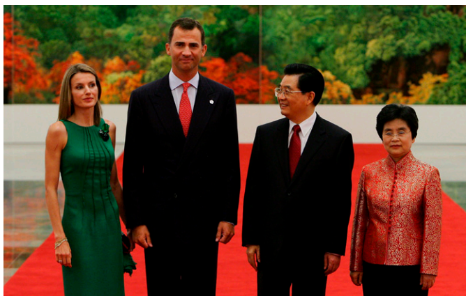
SS. AA. RR. los Príncipes de Asturias, junto al Presidente de China, Hu Jintao, y su esposa durante su visita a China en agosto de 2008.

la última de 2012. Se acordó intensificar esfuerzos para lograr la conclusión de un Convenio para promover las inversiones entre China y la UE; se establecieron nuevos mecanismos de diálogo anual en materia de la innovación tecnológica, seguridad y defensa, y urbanismo/medioambiente junto a otros 50 diálogos ya existentes (sectoriales o temáticos). Se decidió intensificar la cooperación para restaurar la confianza en los mercados financieros y promover la estabilidad financiera a nivel internacional.