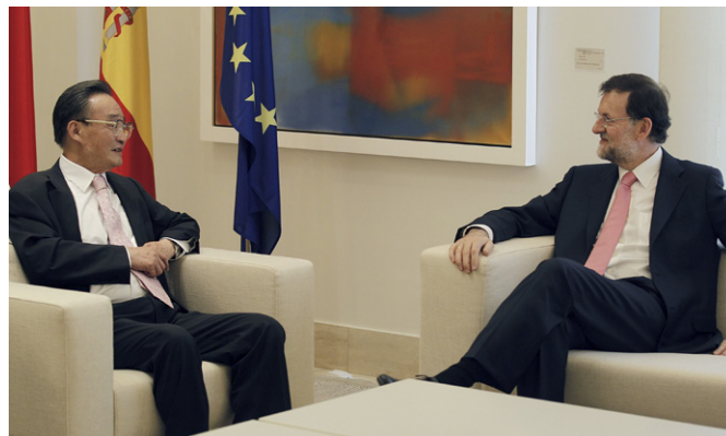
El presidente del Gobierno, Mariano Rajoy, junto al presidente de la Asamblea Nacional Popular de China, Wu Bangguo, durante su visita a Madrid, en mayo de 2012.

Ministro encargado de la Comisión Estatal de Asuntos Étnicos: Wang Zhengwei