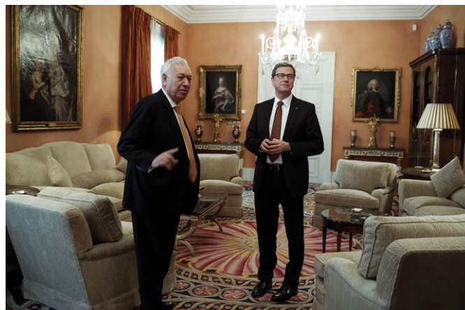
El Ministro de Asuntos Exteriores y de Cooperación, José Manuel García-Margallo, junto al Ministro de Exteriores alemán, Guido Westerwelle, en un encuentro celebrado en el Palacio de Viana de Madrid en diciembre de 2013.

17.03-18.03.07.- S.M la Reina.- Viaje privado.- Schloss Zwing 16.05-17.05.07.- SS.MM. Los Reyes.- Premio Carlo Magno.- Aquisgrán 15.06.07.- Excmo. Sr. Presidente del Gobierno, D. José Luis Rodríguez Zapatero.- Encuentro con la Canciller alemana Sra. Merkel.- Berlín 07.09-08.09.07.- Doña Teresa Fernández de la Vega, Vicepresidenta 1 o del Gobierno.- entenario de la Internacional Soc. de Mujeres.-Stuttgart