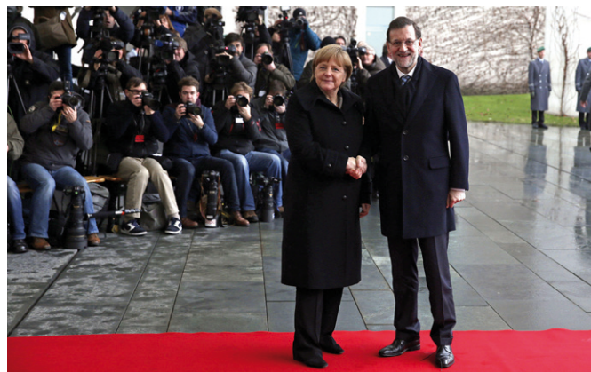
El presidente del Gobierno, Mariano Rajoy, junto a la canciller alemana, Ángela Merkel, durante la cumbre hispano-alemana celebrada en Berlín en febrero de 2013