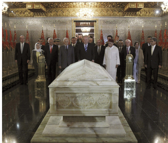
S.M. el rey Juan Carlos, acompañado por los ministros de Fomento, Ana Pastor; de Exteriores y de Cooperación, José Manuel García-Margallo; de Justicia, Alberto Ruiz Gallardón; de Interior, Jorge Fernández Díaz, entre otras autoridades, durante la visita que realizaron al Mausoleo de Mohamed V para hacer una ofrenda floral, en el marco de su visita a Rabat en julio de 2013.

Otro de los principales sectores de actuación de la Cooperación Española lo constituye la Salud, con especial atención a la salud materno-infantil. En este ámbito, además de la cooperación bilateral de apoyo institucional, cabe destacar la puesta en marcha en 2009 de una línea de Apoyo Presupuestario al Sector Salud marroquí,