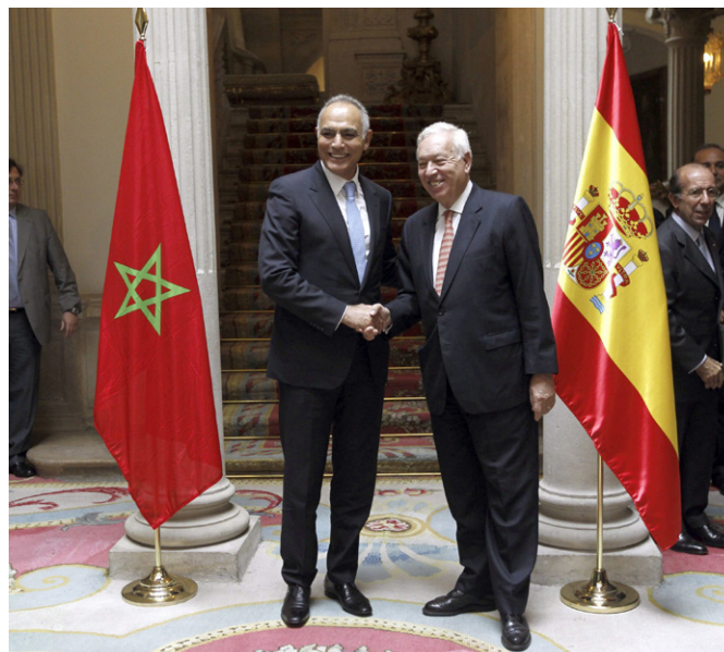
El ministro de Asuntos Exteriores y de Cooperación saluda a su homólogo marroquí, Salaheddine Mezouar, durante su visita al Palacio de Viana, sede del Ministerio de Asuntos Exteriores y de Cooperación, en octubre de 2013.

COBEGA - Implantación: embotelladora de gaseosas - Coca Cola NATBERRY - la principal suministradora de fresas al mercado europeo MUNDI RIZ - acondicionamiento de arroz, 100% de Arrocerías Herba-Ebro Foods DOUNA EXPORT - productos hortofrutícolas frescos y congelados NATURALIM- envasado y comercialización de legumbres y arroz y derivados. (Alimentos Naturales S.A.)