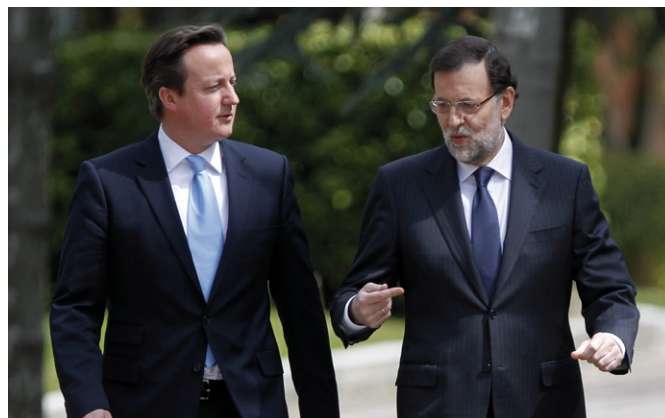
El primer ministro británico, David Cameron, conversa con el presidente del Gobierno, Mariano Rajoy, durante un paseo por los jardines del Palacio de la Moncloa, en el marco de la visita que realizó a España en abril de 2013.

Existe una presencia importante de empresas españolas en el Reino Unido (siendo Zara la empresa comercial de mayor envergadura en este país), más de 300 compañías, muy diversificada por sectores, entre los que destacan: bancos y servicios financieros; infraestructuras de transporte; energía; medioambiente y tratamiento de residuos y agua; distribución de productos de consumo (moda,