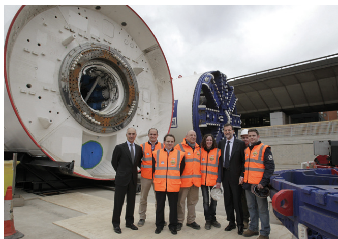
El presidente del Gobierno, Mariano Rajoy, con el presidente de Ferrovial, Rafael del Pino, durante su visita a Londres en el año 2012 a las obras que desarrolla una tuneladora española en la capital británica.

Canje de notas por el que se adopta el Convenio entre el Reino de España y el Reino Unido de Gran Bretaña e Irlanda del Norte en nombre de Anguila, relativo