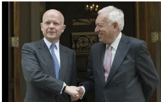
El ministro de Asuntos Exteriores y de Cooperación, José Manuel García-Margallo, saluda a su homólogo británico, William Hague, durante su visita a Londres en mayo de 2012.

David William Donald Cameron fue elegido Primer Ministro en las Elecciones Generales de mayo de 2010. Encabeza un gobierno de coalición conservador / liberal demócrata. Nació en Londres el 9 de octubre de 1966, pero creció en Berkshire. Cursó la educación secundaria en Eton College y estudios universitarios en la Universidad de Oxford, donde estudió Filosofía, Ciencias Políticas y Económicas (PPE), obteniendo los mejores resultados de su promoción. Tras licenciarse, trabajó para el Departamento de Investigación del Partido Conservador y, posteriormente, como Asesor Especial en el gobierno, primero del Ministro de Economía y, después, del Ministro del Interior.